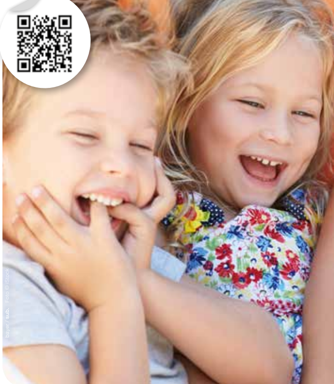
bayer / leub.